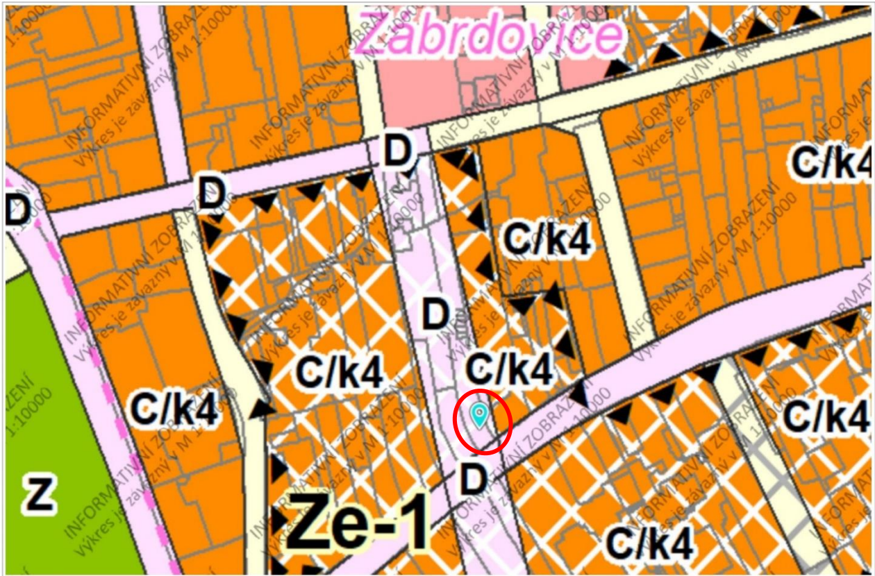
Návrh nového Územního plánu města Brna, 2022