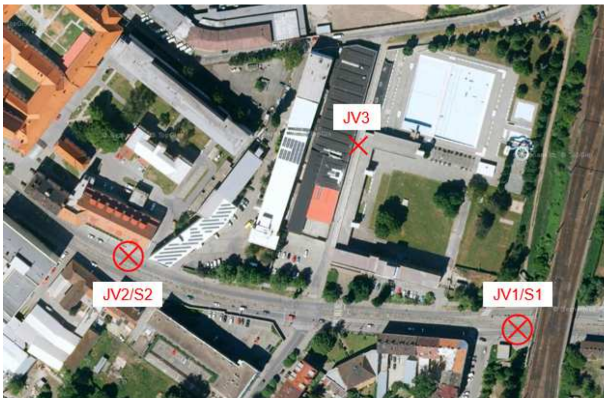
Obrázek 1: Místo provedení jádrového vývrtu