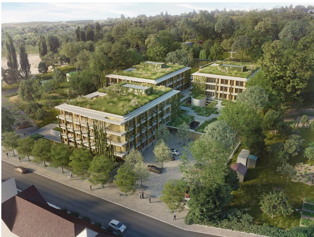
Vizualizace RANGHERKA 5, s. r. o.