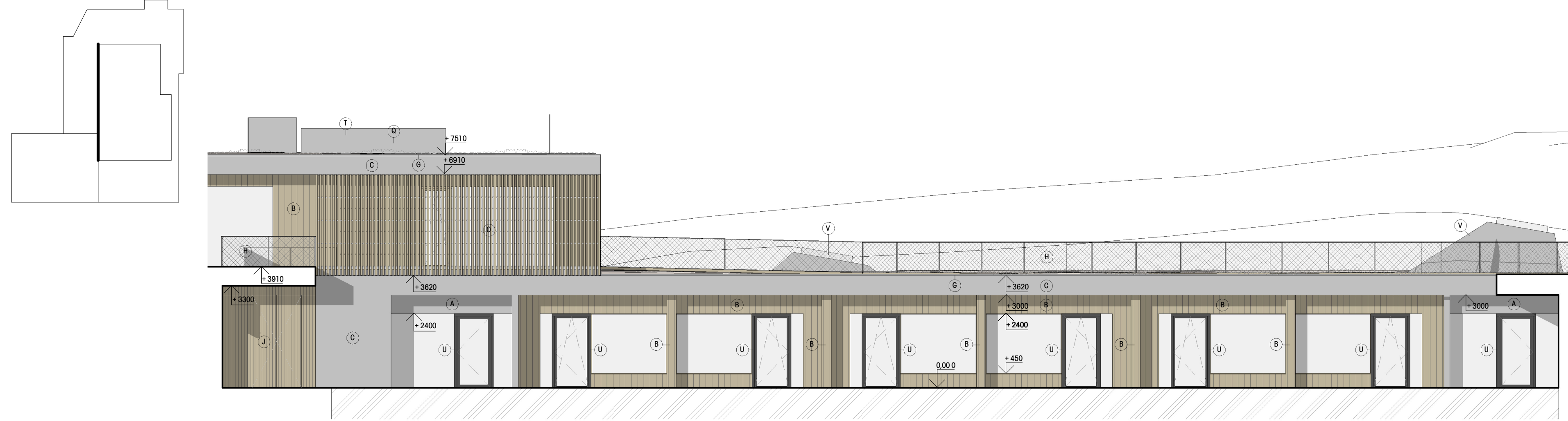
POHLED ATRIUM 2