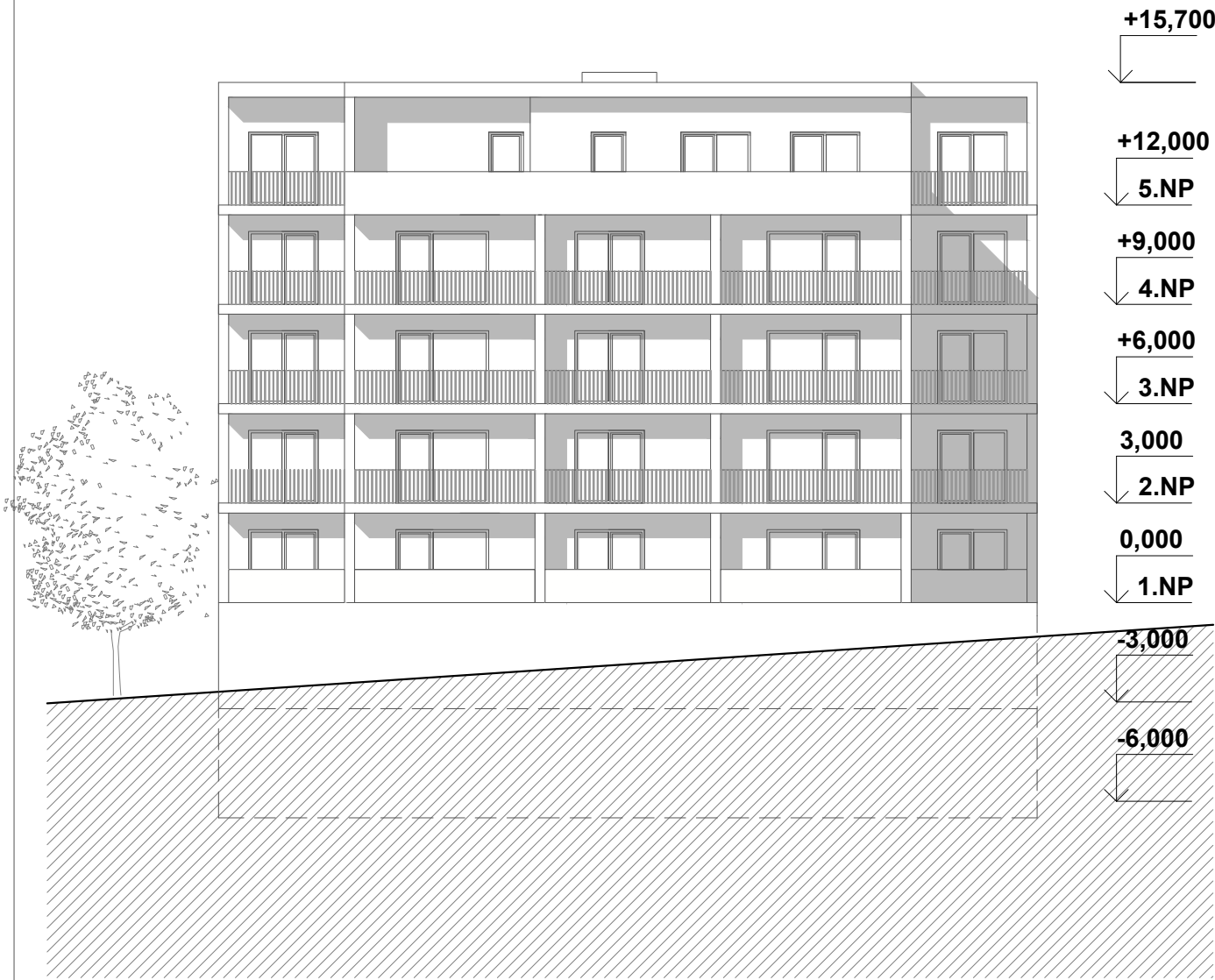
POHLED ZADNÍ (OD ULICE PETRA KŘIVKY) -JIHOVÝHODNÍ