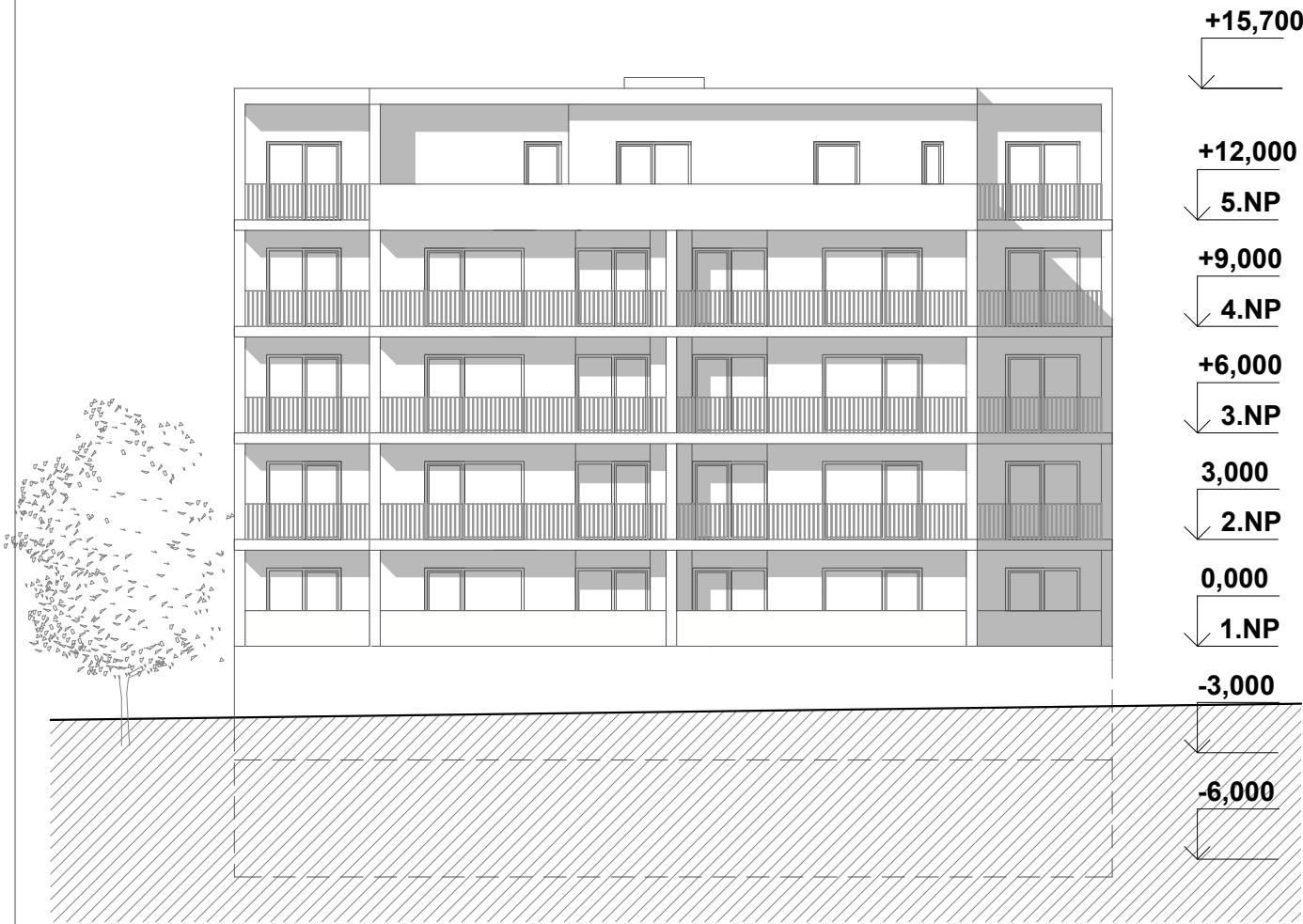
POHLED ZADNÍ (OD ULICE PETRA KŘIVKY) -JIHOVÝHODNÍ