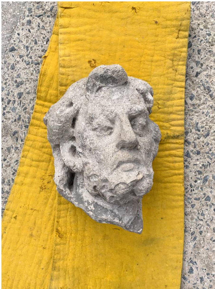
Detail odlomené hlavy světce