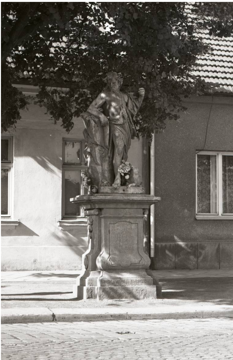
Celková fotografie sochy světce se soklovou architekturou na původním místě (2.pol.20.stol.)