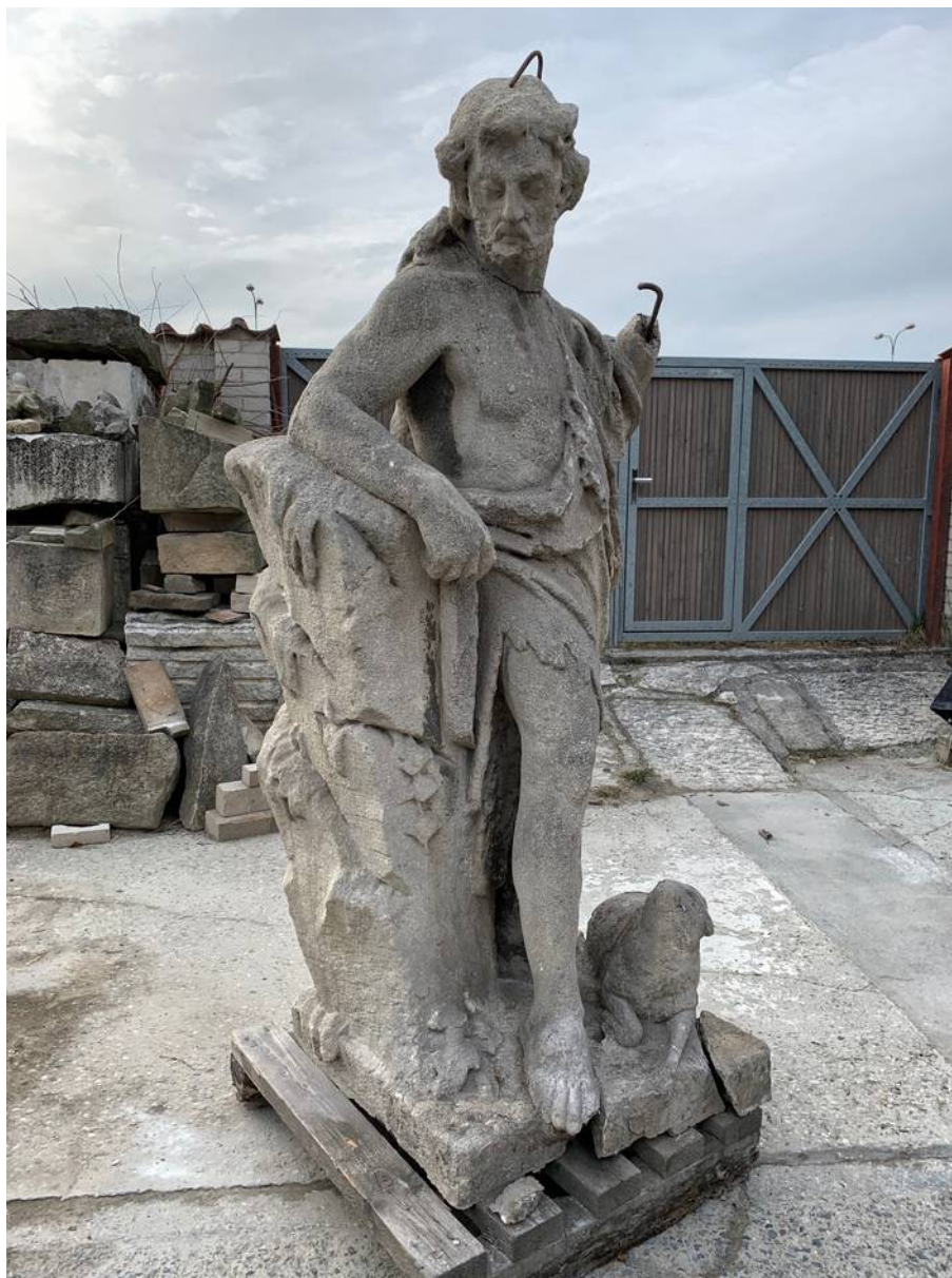
Celkový snímek světce s provizorně osazeným fragmentem hlavy