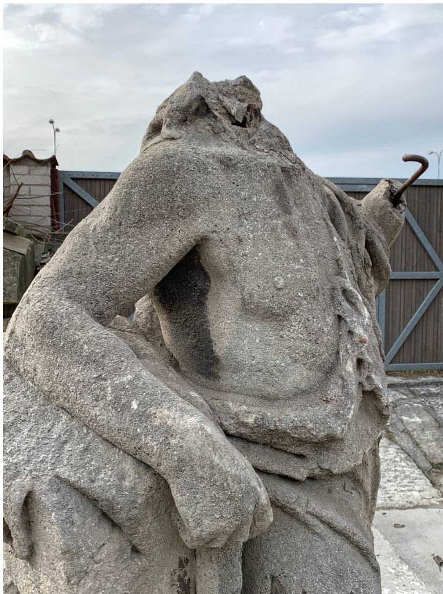
Detail pravé horní části světce