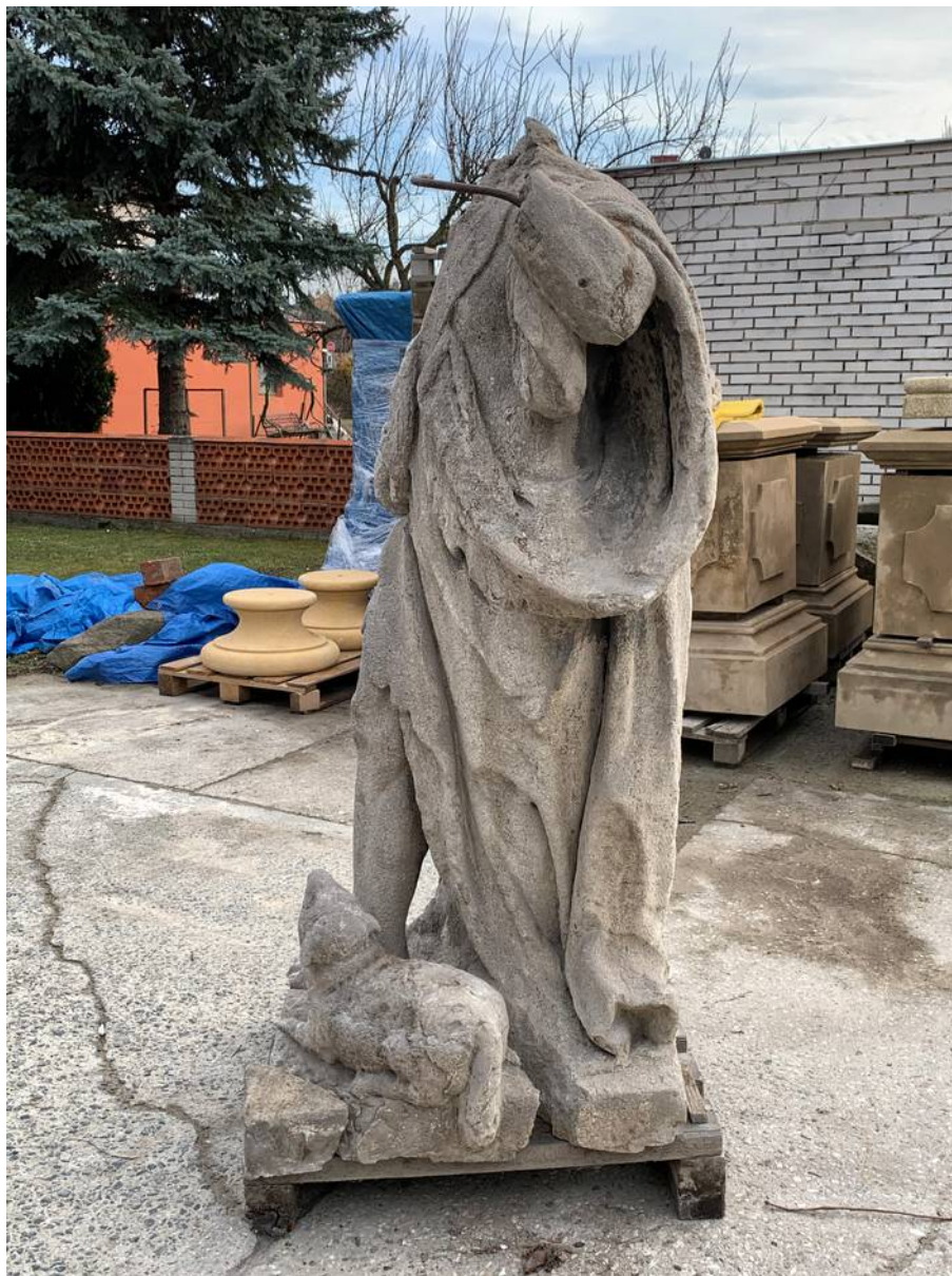
Socha sv. Jana Křtitele - celkový boční pohled