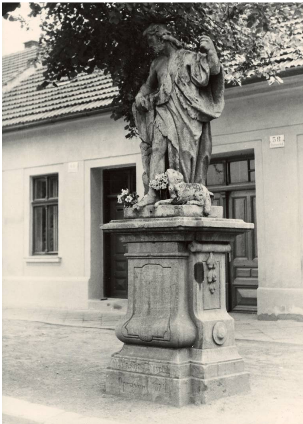
Celková fotografie sochy světce se soklovou architekturou na původním místě (2.pol.20.stol.)