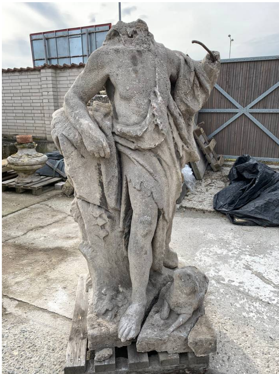
Socha sv. Jan Křtitele – celkový čelní pohled