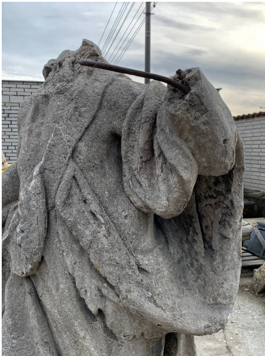
Detail levé horní části figury s odlomenou levou rukou - sekundární kovová armatura