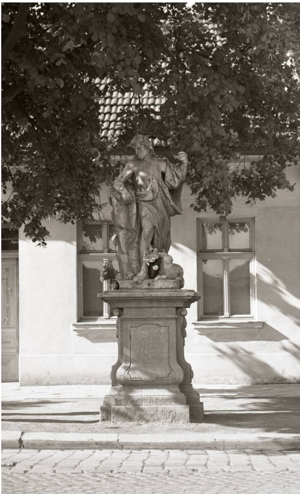
Celková fotografie sochy světce se soklovou architekturou na původním místě (2.pol.20.stol.)