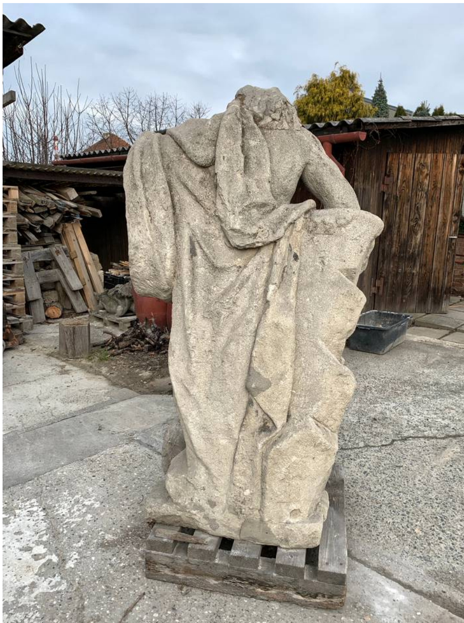
Socha sv. Jana Křtitele – celkový zadní pohled