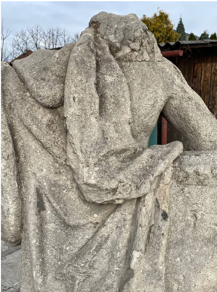
Detail horní části zad a drapérie - četné mechanické defekt, sekundární tmely a lokální biologické napadení povrchu mechy