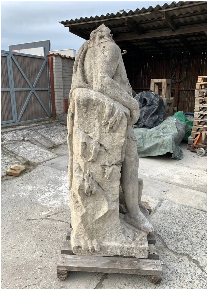
Socha sv. Jana Křtitele - celkový boční pohled