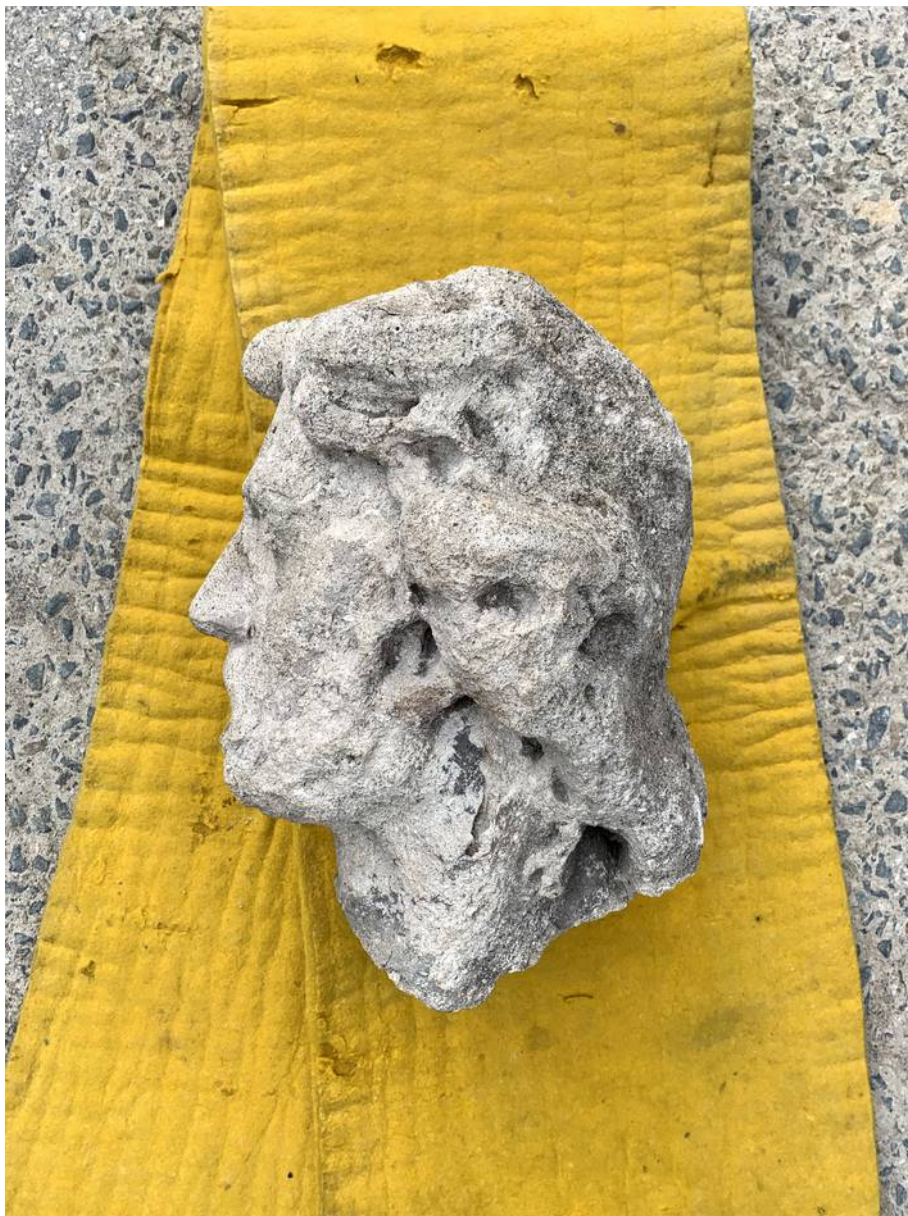
Detail odlomené hlavy světce