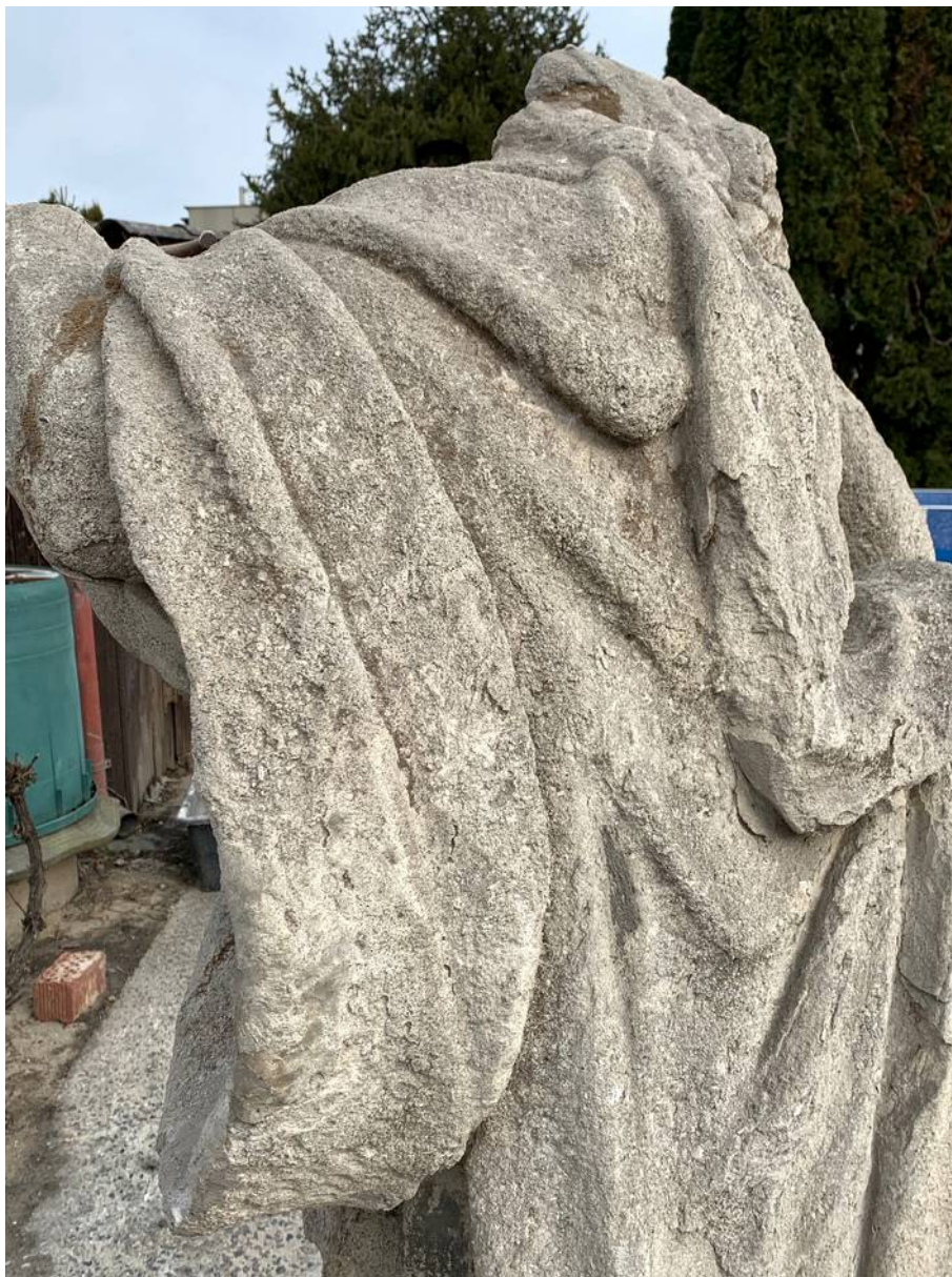
Detail drapérie horní části zad - četné mechanické defekty, sekundární tmely a lokální biologické napadení povrchu mechy