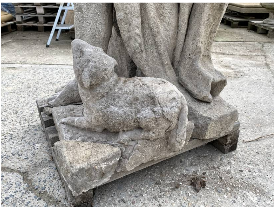
Detaily odlomené části plintusu s plastikou beránka - četné mechanické defekty a sekundární cementové tmely