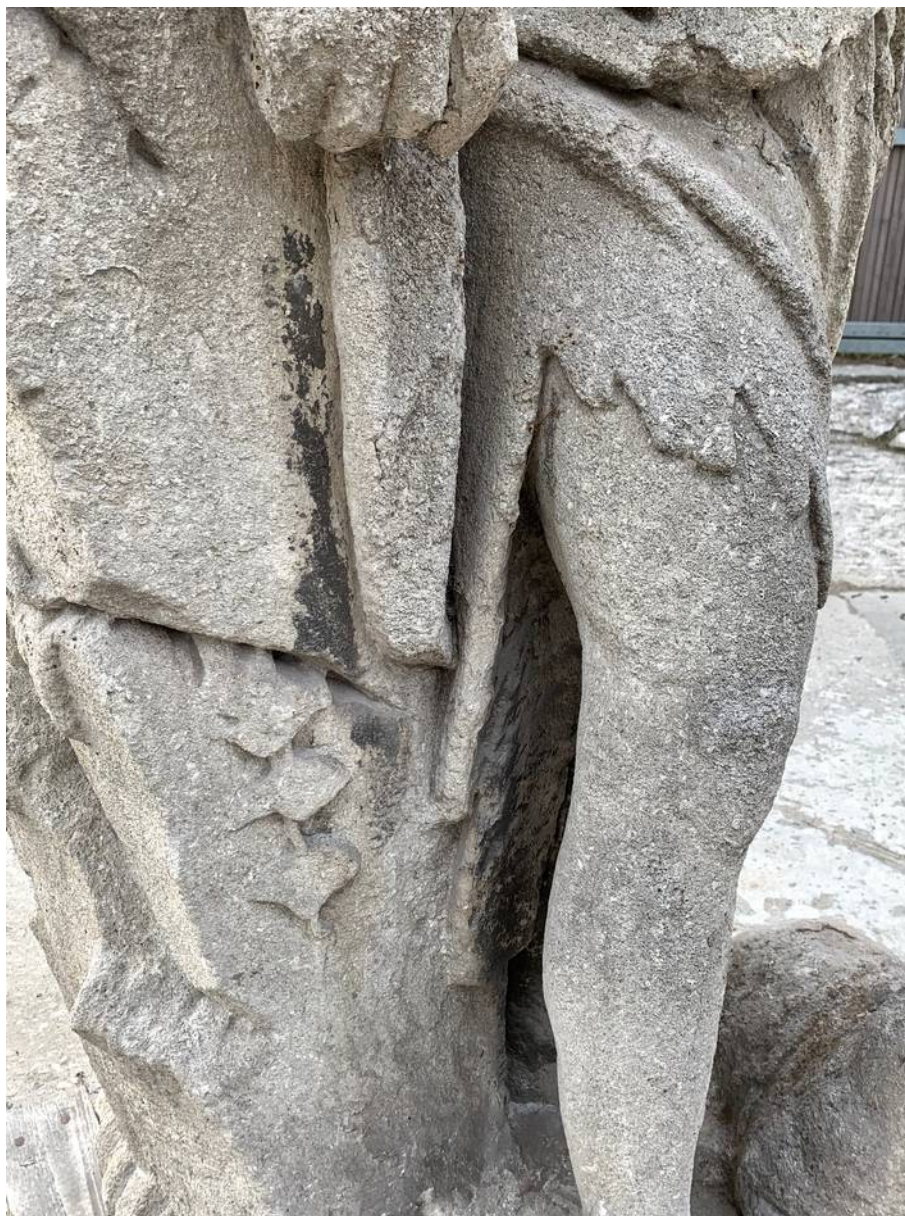
Detail spodní části figury – ve srážkových stínech uhlíkové krusty